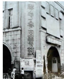
琴参電鉄・多度津棧橋通駅